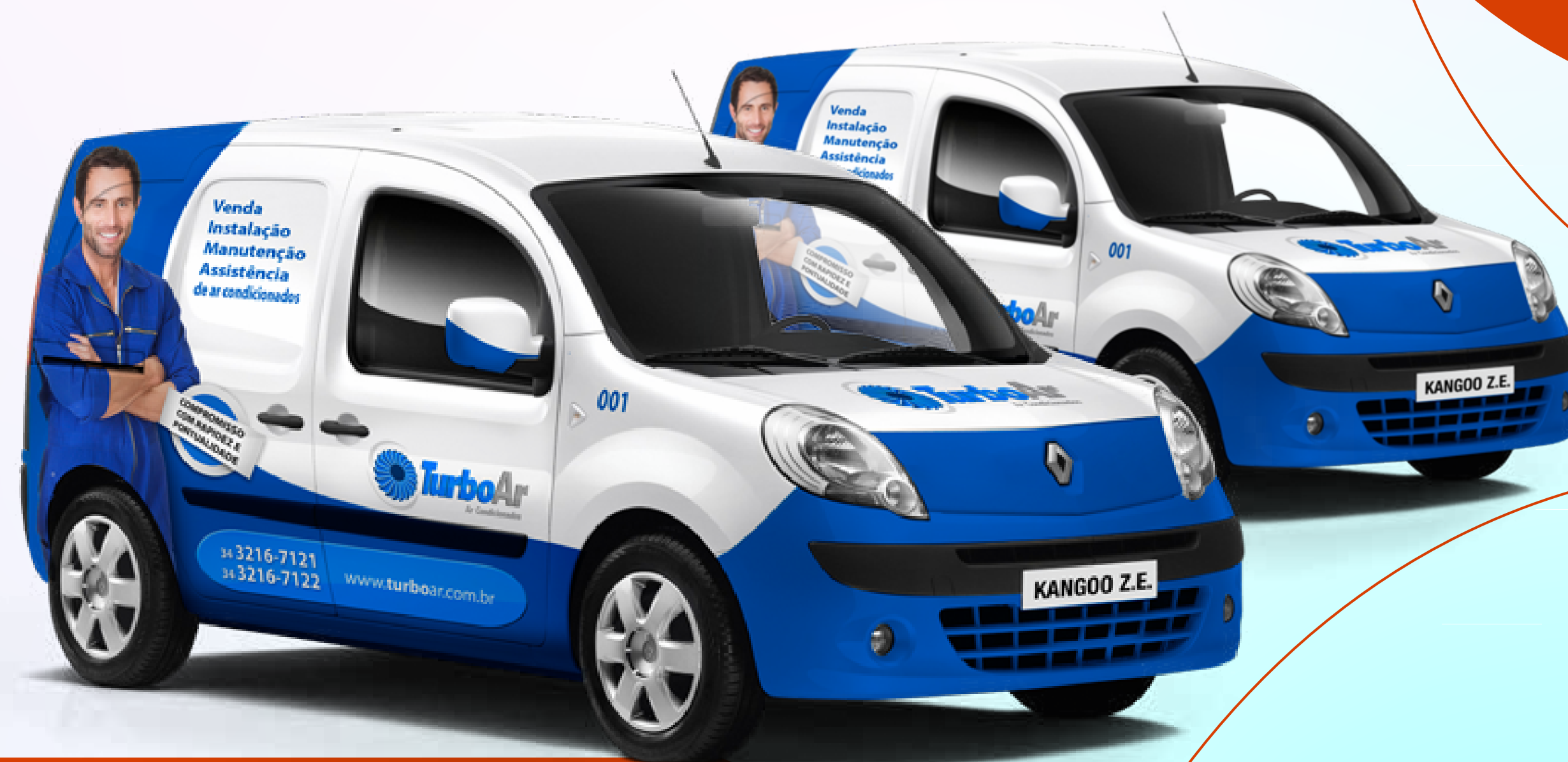
Envelopamento de Veículos