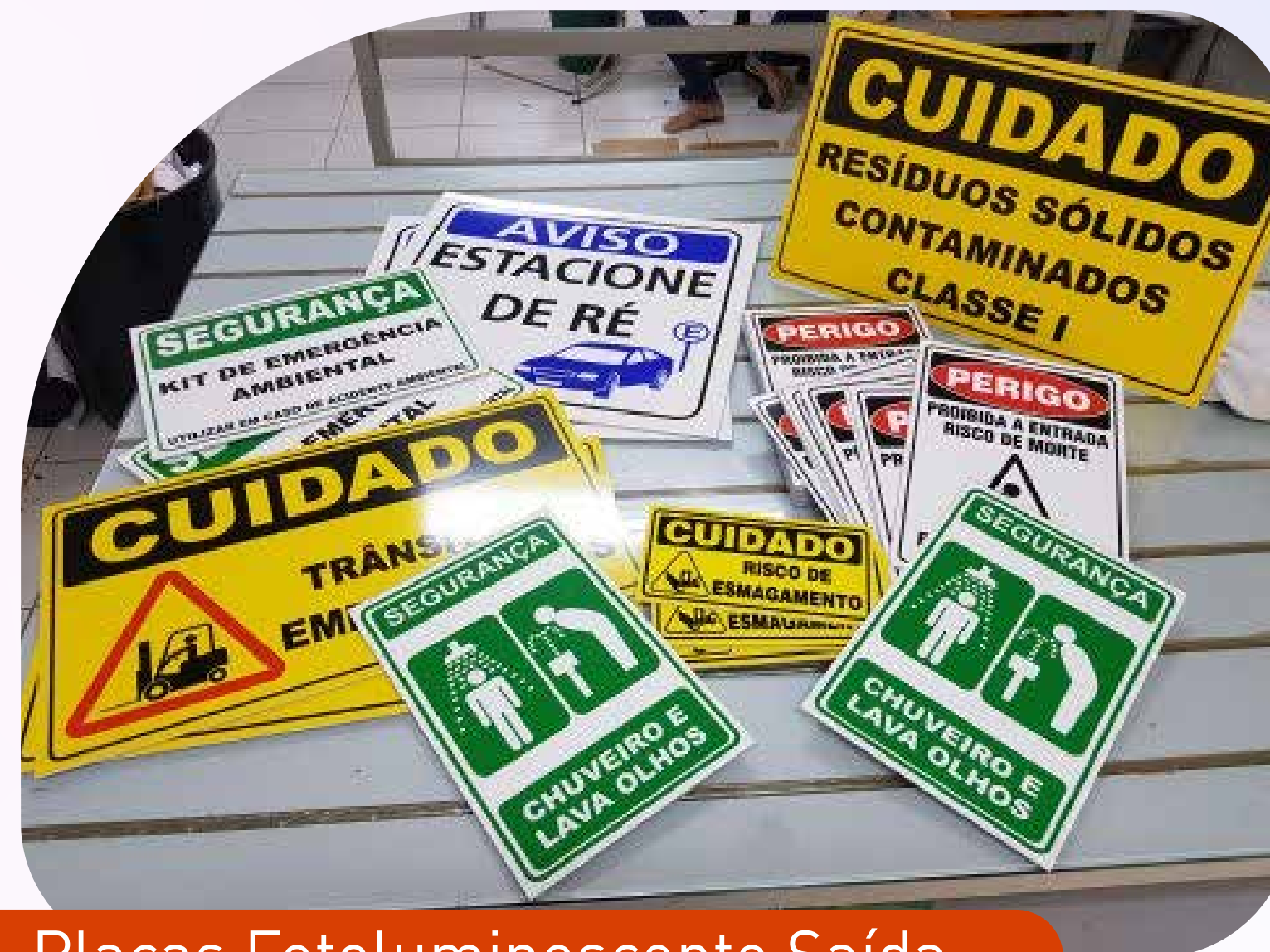
Placas Fotoluminescente Saída

A Sinalização Industrial desempenha papel fundamental na segurança dos colaboradores com a identificação de carros, caminhões, placas, tubulações, equipamentos, áreas de risco, orientação de áreas perigosas e rotas de fuga. A Saturno dispõe de soluções para serviços específicos de sinalização para empresas na indústria visando atender a demanda de identificação de seu patrimônio e setores através de sinalização impressa e fotoluminescente.